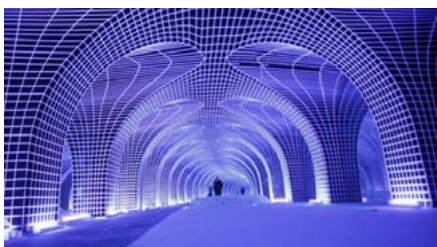
Palazzo Pepoli Museo della Storia di Bologna