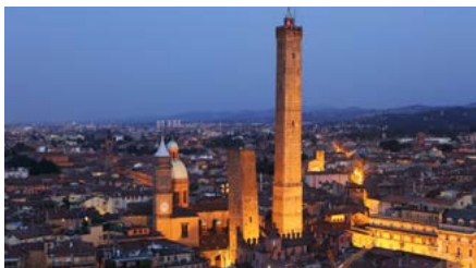
Le due torri: Asinelli e Garisenda

Sede storica di IRC, Bologna è una città antica e affascinante che mescola storia, cultura e gastronomia. Con i suoi famosi portici, l'atmosfera vivace e la ricca tradizione culinaria, Bologna è un tesoro da scoprire. La sua posizione centrale e facilmente raggiungibile, la rende una città di grande attrattiva!