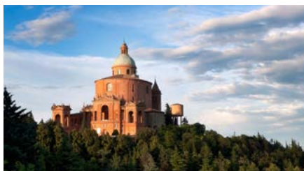
Santuario Madonna di San Luca