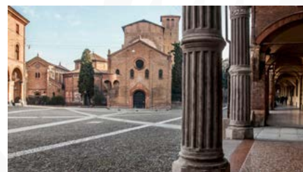
Basilica santuario Santo Stefano Complesso delle sette chiese