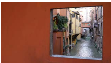
Canale delle Moline