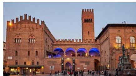
Palazzo Re Enzo