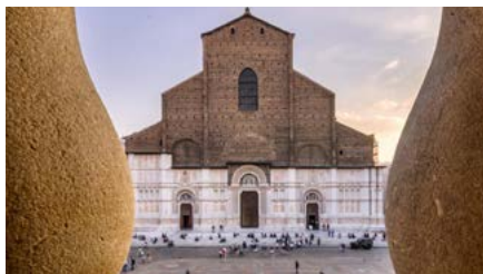
Basilica di San Petronio