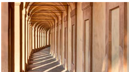
Portici di San Luca