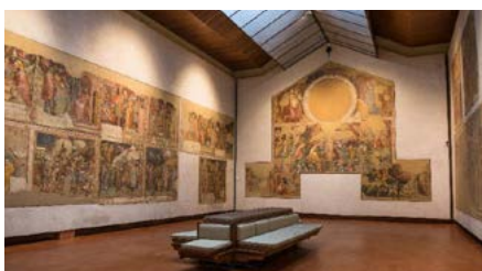
Pinacoteca Nazionale di Bologna