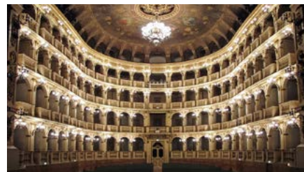
Teatro Comunale di Bologna