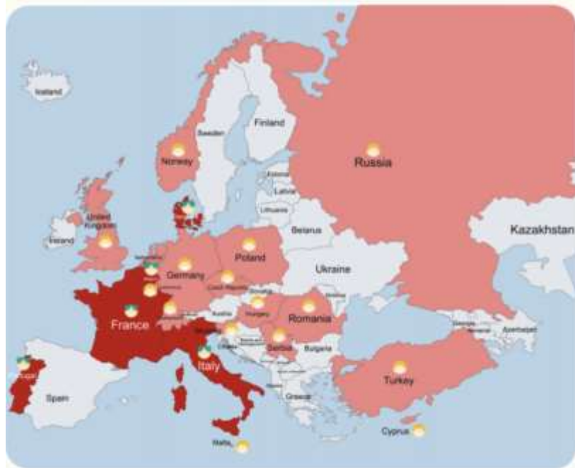
Mappa europea della diffusione della formazione in tema di RCP